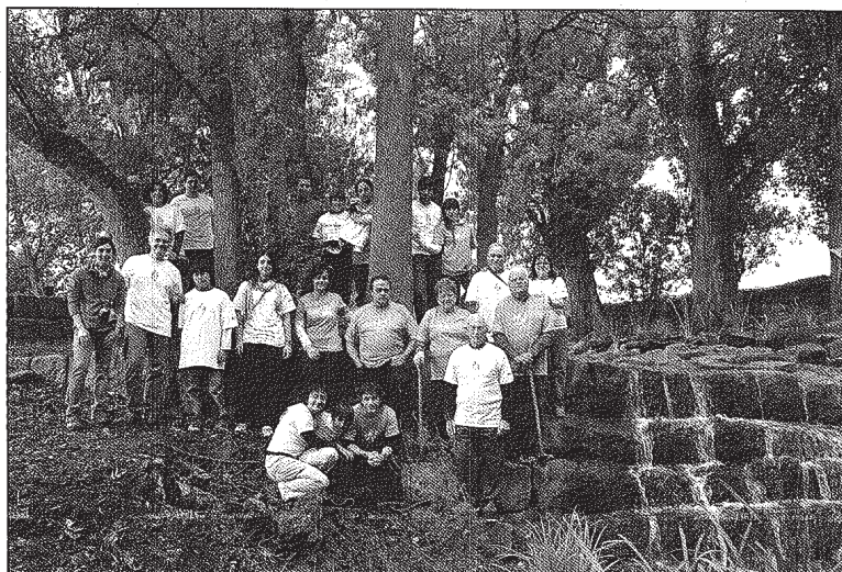
Alguns dels participants en la plantada, al costat de la peixera de Ratera

Unes 30 persones voluntàries van participar en aquesta jornada lúdica i de conscienciació ambiental, durant la qual es van plantar uns 50 exemplars de plantes de ribera, resistents a les riuades i canvis de cabal propis dels nostres rius. Principalment es tractava de salzes, canyís o lliris grocs, espècies que han estat desplaçades, en