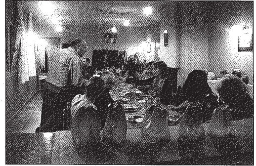
Els pebrots decorats van servir d'ambientació de la castanyada

van passar a decorar el restaurant durant la nit de Tots Sants. Aquest és el segon any que es porta a terme aquest taller de decoració de pebrots i gràcies a la bona acollida del mateix, ja s'està pensant en alguna novetat per a la propera edició.