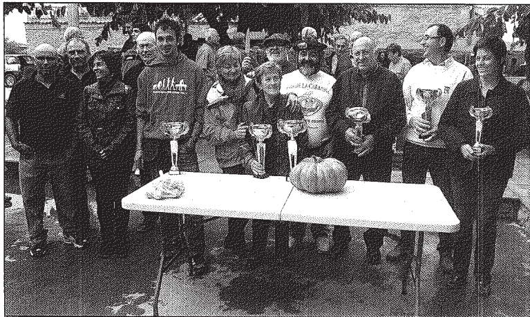
Imatge de grup dels guanyadors del concurs de Sedó i dels seus organitzadors

Després del concurs, tot aquell que va voler, va poder endur-se un tros de carabassa gegant a casa seva.