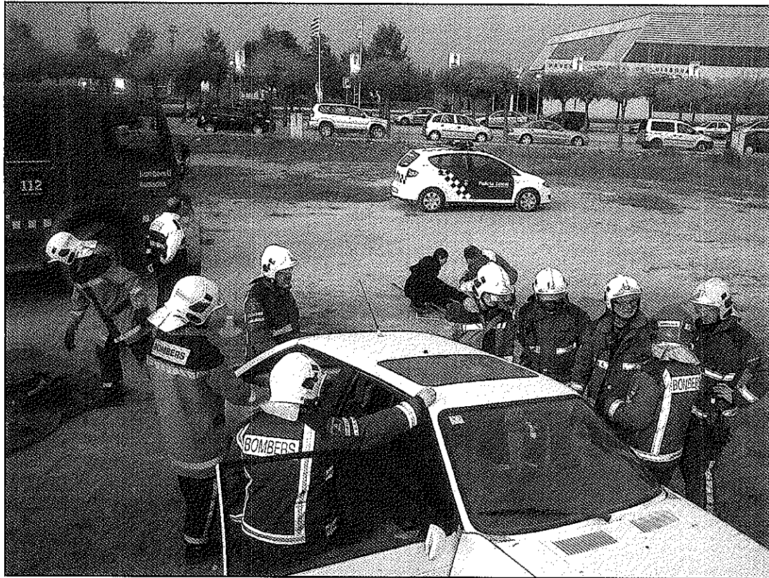
El simulacre va realitzar-se al voltant de la zona esportiva de la població