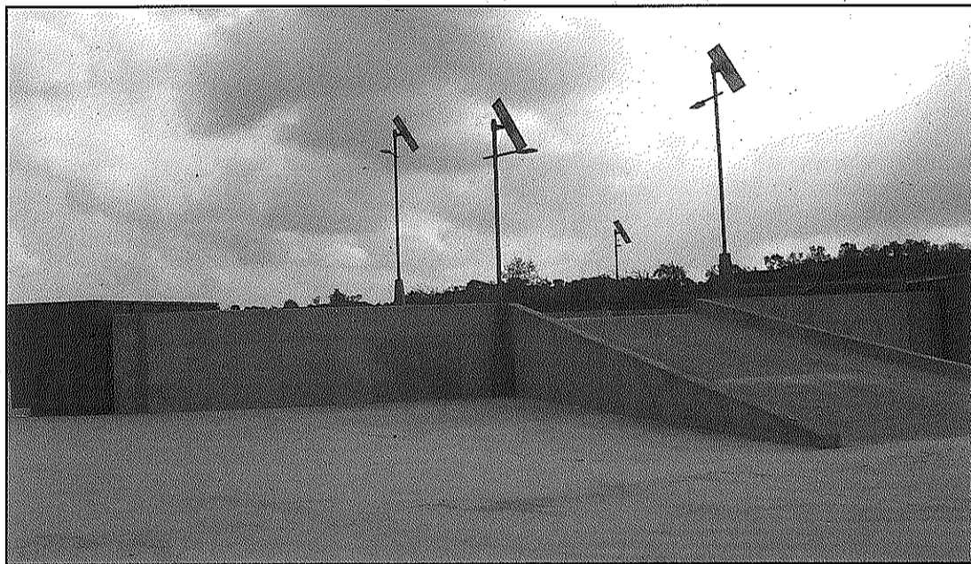
Els veïns de Guissona podran començar ja a fer ús d'aquest nou equipament

Amb aquesta obra es complementa el servei comarcal de deixalleria. Des d'ara, la Segarra disposarà de tres deixalleries, dues de fixes a Cervera i Guissona, i una mòbil que es desplaça per tots els municipis de la comarca.