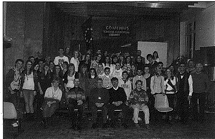
Imatge de grup dels alumnes i professors presents a l'institut polonès

estat una gran experiència ja que era el primer intercanvi que realitzaven. Tot i ser curt han destacat que en una setmana han pogut aprendre moltes coses sobre les seves tradicions. Els alumnes destaquen que han après que tot i viure en països molt diferents en el fons som molt similars. S'han sorprès de la cortesia i la hospitalitat rebuda. Alhora els alumnes van poder provar plats típics de Polònia, Alemanya i Turquia. Finalment, els alumnes agraeixen als professors, a les famílies amfitriones i als coordinadors aquesta oportunitat d'intercanvi.