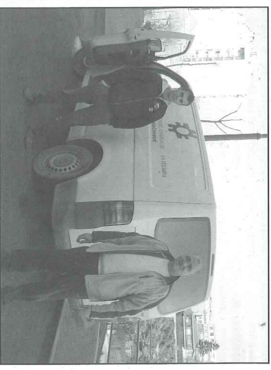
La nova brigada ha començat a treballar aquests dies

Els Plans d'ocupació es desenvolupen gràcies al suport del Departament d'Empresa i Ocupació, el SOC i el Fons Social Europeu.