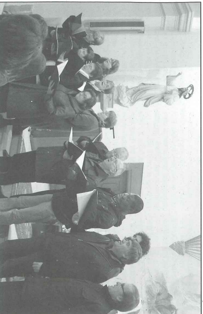
Massoteres enCanta va fer la seva estrena durant la tradicional Missa del Gall

Només quatre dies després, el 28 de desembre, la formació va fer la seva segona actuació, i primera fora del municipi, davant els ancians residents de la Fundació CAG de Guissona.