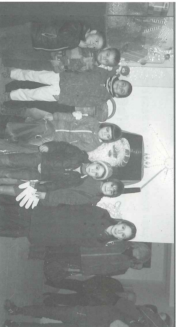
FLOREJACS. - Com l'any passat, el Rei Melcior va dedicar enguany uns instants de la seva atregada agenda, durant la Nit de Reis, per visitar el nucli de Florejacs, on va recollir les cartes dels petits i els desitjos dels més grans.