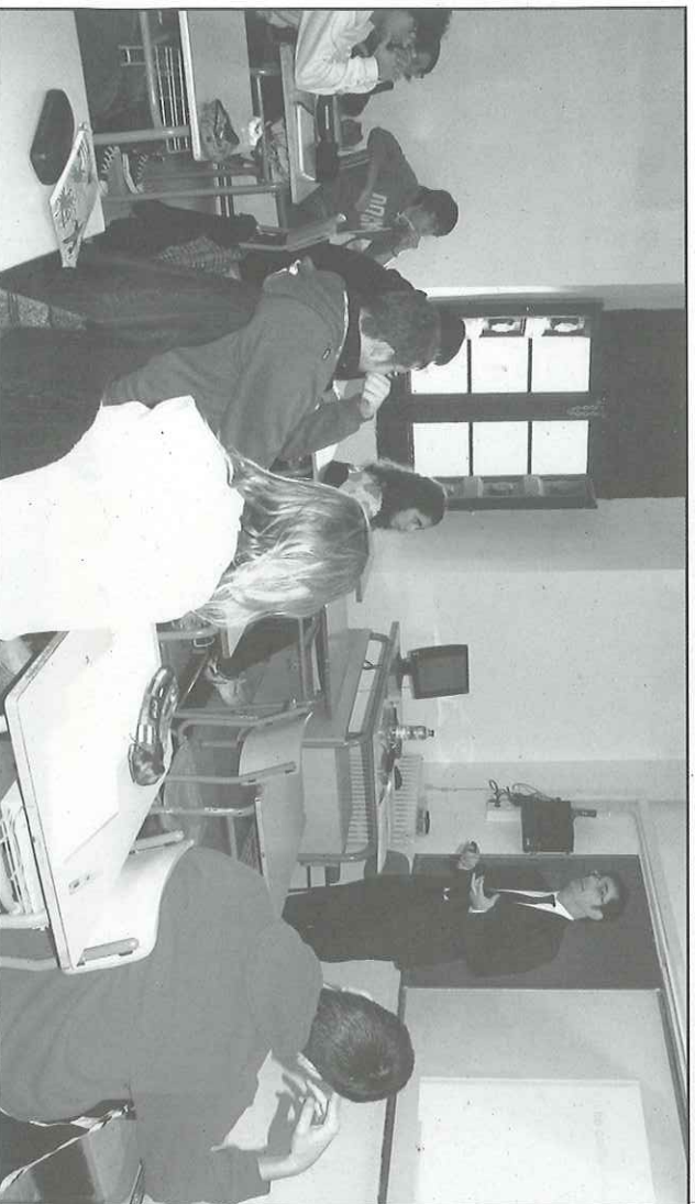
Una de les sessions que, sobre formació bancària, va oferir Caixa Guissona a l'institut Antoni Torroja

Donat que avui en dia és pràcticament impossible viure sense els bancs, la intenció d'aquesta iniciativa, que es preveu continuar en el futur, és que els joves disposin d'una millor base per a gestionar les seves necessitats financeres.