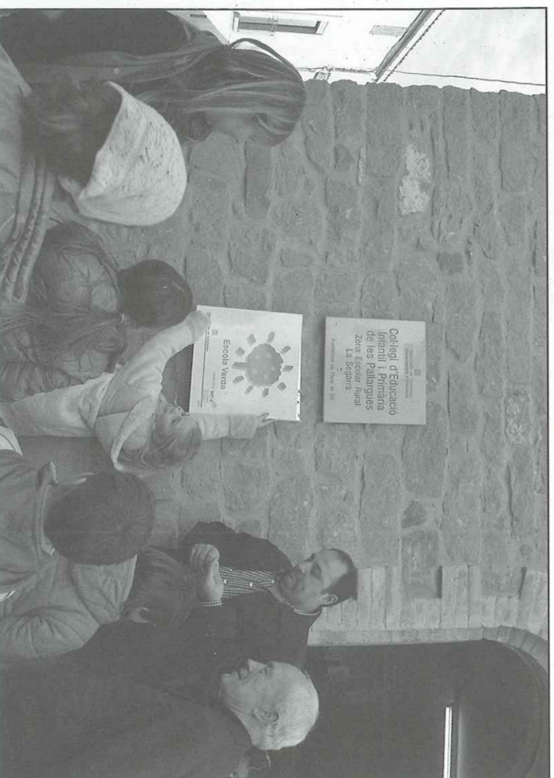
Els mateixos escolars van encarregar-se de penjar la placa d'Escola Verda

Després que les professores expliquessin què significa aquest distintiu i les accions que s'estan realitzant al centre quant a sensibilització ambiental, durant l'acte es va organitzar una activitat comuna per a tots els assistents que va consistir en l'elaboració d'un arbre de "desitjos verds", en el qual tot el món va poder escriure el seu desig en aquest àmbit. Finalment, es va col·locar la placa d'Escola Verda al costat de l'accés prin-