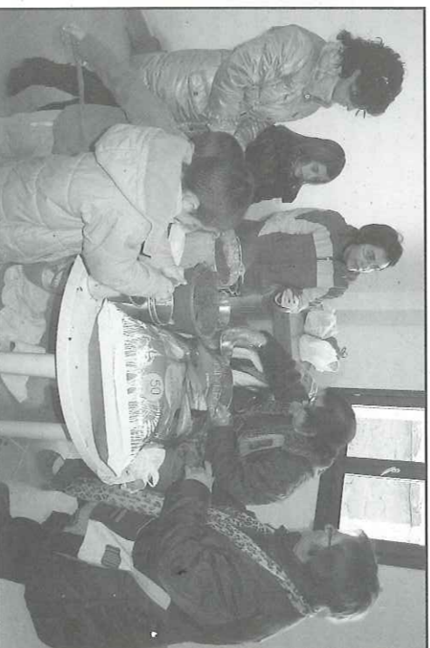
El taller va dur-se a terme al local social de Florejacs

La tradició dels majos, recuperada pels organitzadors de la Fira de la Flor de Florejacs, és l'eix d'uns dels certàmens florals de la Dama de les Flors, que tindrà lloc per setena edició consecutiva els propers dies 7 i 8 d'abril a Florejacs. Enguany, com a novetat, els majos que es presentin al concurs s'exposaran a l'interior de l'església parroquial, enllaçant amb la tradició religiosa que en feia una decoració del monument durant les dates de la Setmana Santa.