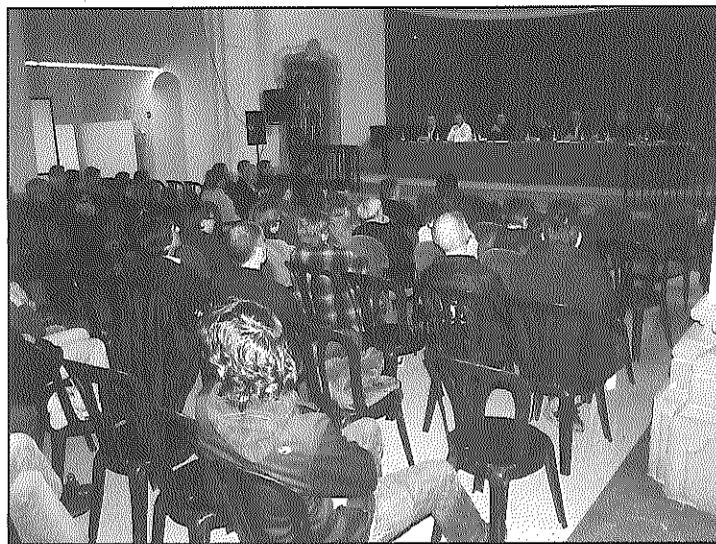
El debat va aplegar al voltant d'un centenar de persones a l'auditori

Durant el debat, tots els ponents van respondre afirmativament a les qüestions que els interrogaven sobre si consideraven que el dèficit fiscal de Catalunya vers Espanya perjudica el benestar dels catalans, la viabilitat d'una Catalunya independent integrada dins la Unió Europea i el suport a una consulta al poble català sobre l'exercici del dret a l'autodeterminació nacional. Per altra banda, les diferències van versar sobre