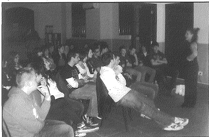
La sessió va ser del grat dels nombrosos joves assistents.

En total, una cinquantena de joves de Guissona van passar una vetllada al Casal Jove tot gaudint d'aquest espectacle.