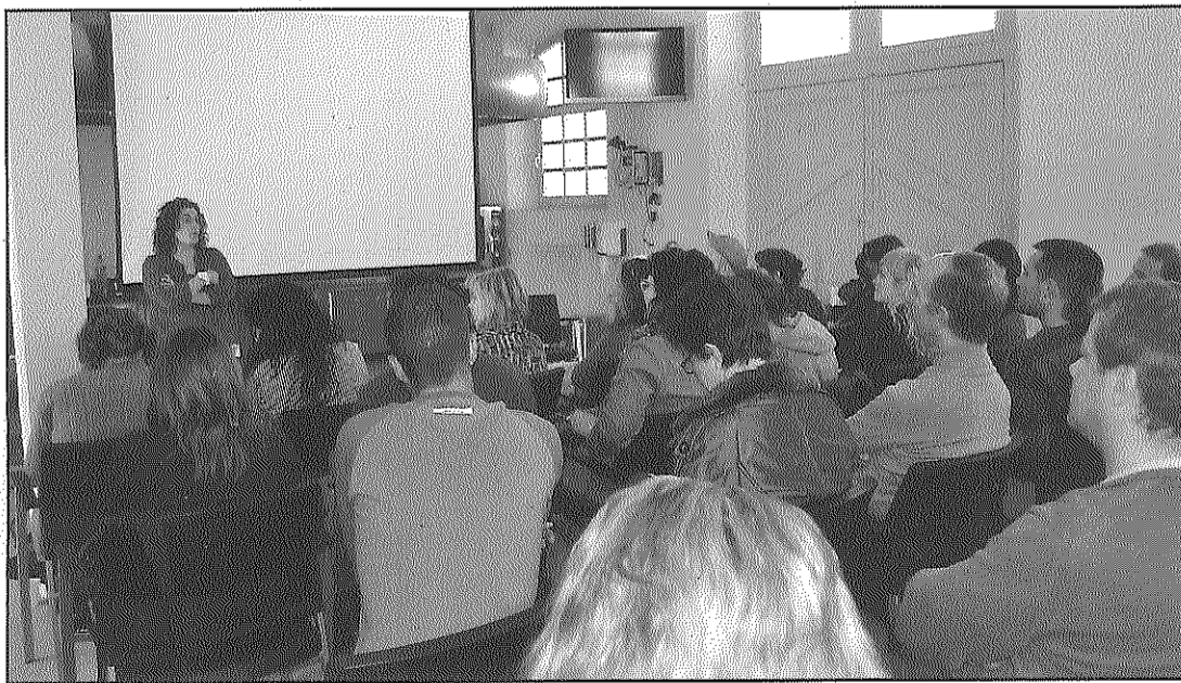
Una de les ponències que va incloure la jornada del passat dissabte

La jornada del dissabte va ser impulsada per donar a conèixer a la població general els avantatges i els benefi-