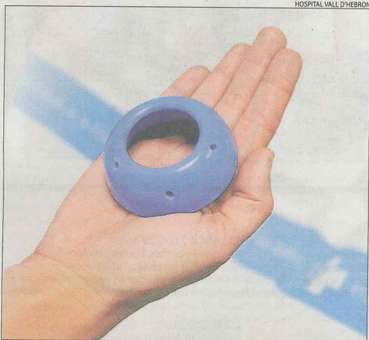
Imatge de l'anell utilitzat en l'assaig de la Vall d'Hebron.

El pessari costa 38 euros, s'introdueix per la vagina sense cirurgia i no genera molè-