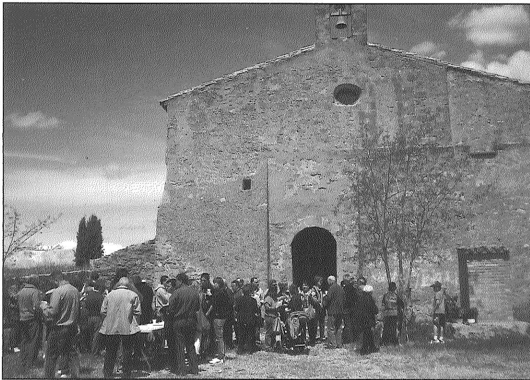
Els participants van fer plegats el vermut després de la missa a l'ermita de la Mare de Déu de Santesmasses

esmorzar a base de coca i xocolata i el vermut després de missa, gaudint del bon ambient i la millor climatologia. Novament, l'organització ha estat un èxit, pel que l'Ajuntament de Torrefeta i Florejacs ha volgut felicitar el Centre Social precisament per la bona acollida d'aquesta convocatòria.