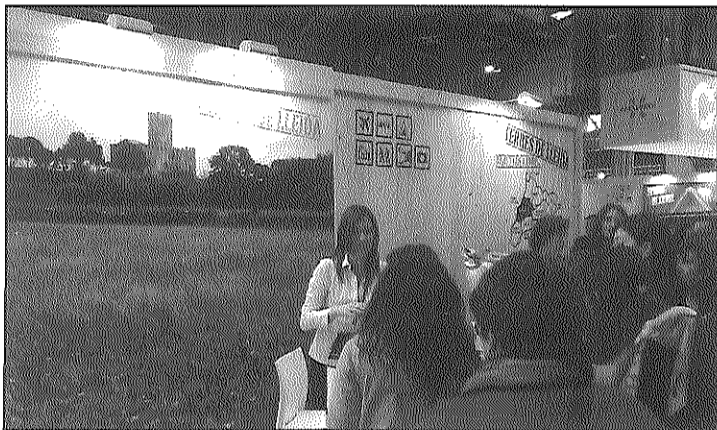
La Segarra va formar part de l'estand de l'Agència Catalana de Turisme

L'afluència de persones interessades en la nostra comarca va ser destacable, interessant-se majoritàriament pels punts visitables de la Segarra com ara els castells, la ciutat de Cervera o la vila de Guissona, així com també pel senderisme, les rutes en BTT i els diferents tipus d'allotjaments.