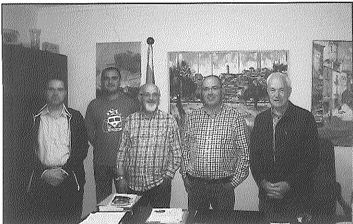
Visita del Consell a Granyena

d'Alcaldes com a òrgan mitjancer. Es van comentar en general els diferents serveis que el Consell Comarcal presta en aquests dos ajuntaments, i es van presentar altres serveis que s'estan implantant o ampliant als municipis. Tots dos municipis van valorar la situació actual de les administracions públiques, destacant la necessitat de col·laborar a nivell tècnic i mancomunar serveis entre administracions. A la vegada, en ambdós casos es va expressar, per part de tots els presents, la intenció de seguir tenint una comunicació fluida entre l'ajuntament per una banda i el Consell per l'altra.