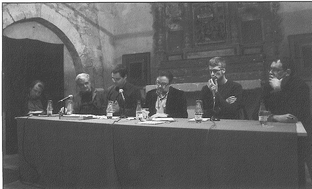
Els ponents que van prendre part en la taula rodona organitzada a l'església de Sant Joan

L'exposició fotogràfica "Un paisatge per demà", que recull una trentena de fotografies de paisatges de la Segarra i il·lustra el document emès pel Fòrum l'Espitllera, va servir per vestir les parets de l'església de Sant Joan, sala on va tenir lloc la conferència, i s'hi mantindrà durant les dues properes setmanes. Per altra banda, el Fòrum l'Espitllera manté la seva col·laboració amb el projecte de la Paeria de Cervera per la confecció d'una carta del paisatge municipal i la seva comissió de paisatge seguirà endavant amb els seus treballs d'anàlisi, defensa i reivindicació del paisatge segarrenc.