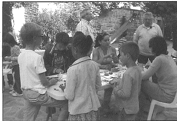
El temps va acompanyar la celebració de tots els actes

Entre els actes programats, va haver-hi una tirada de bitlles, una missa en honor a Sant Isidre, un vermut popular, el concurs de dibuix infantil del municipi i jocs per als petits, mentre els més grans jugaven també a les cartes o bé feien tertúlia sota els arbres de la plaça. El temps va permetre que es poguessin celebrar tots els actes tal i com estaven previstos.