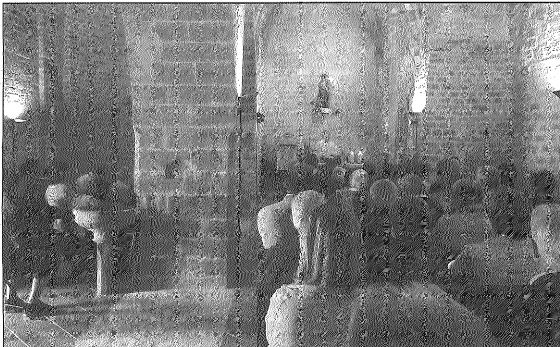
Els veïns del municipi van omplir la vella església de Sant Antolí

Com a punt i final de la diada, un dinar popular, que inicialment estava previst realitzar a l'esplanada que envolta l'església, es va haver de traslladar al local social l'Amistat per motius climatològics.