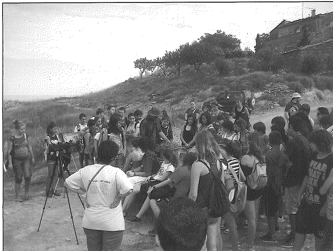
Membres de l'Associació Espai Llobregós van acompanyar els alumnes durant la visita

L'activitat va acabar a peu dels patamolls, on un membre de l'SCH, entitat que està fent un seguiment i restauració de zones humides de la Plana de Lleida a través del Projecte Basses, va comentar la gran vàlua d'aquesta zona humida per a l'herpetofauna, sobretot per als amfibis, ja que es tracta del segon punt amb més biodiversitat herpetològica de la comarca.