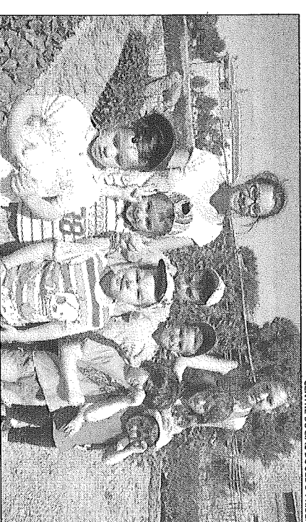
CENTRE SOCIAL DE SEDÓ I RIBER