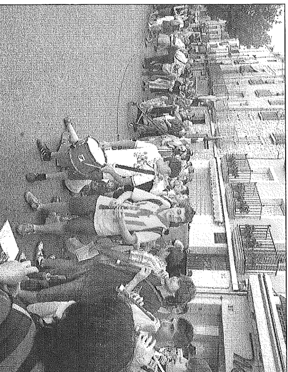
Imatge del pas de la Marxa per Cervera

Responent a la crida feta des de l'entitat la Segarra per la Independència, mig miler de persones varen participar dissabte en els actes de la Marxa per la Independència que durant tota la jornada es van desenvolupar per la comarca. Una cinquantena de vehicles, cotxes, motos i bicicletes hi van participar. ■