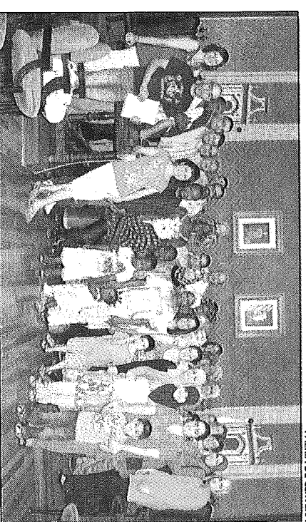
PAERIA DE CERVERA