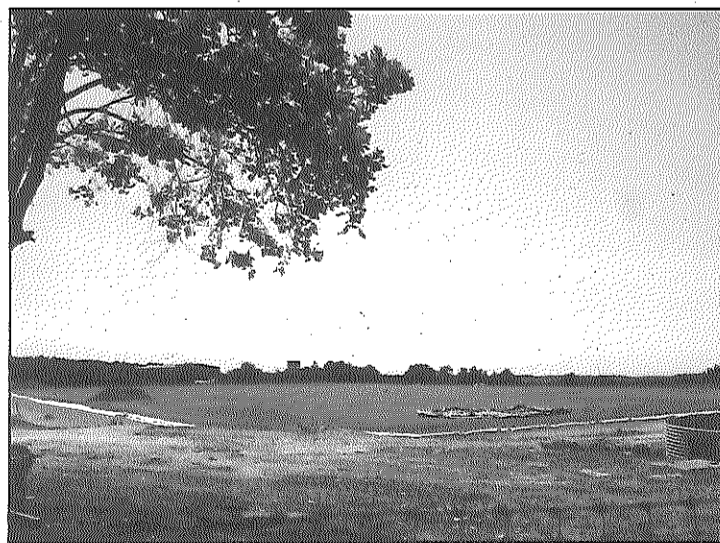
Les obres han delimitat i aplanat el que serà el terreny de joc

De moment, la proposta està tenint "una bona acollida", segons l'alcalde, Pere Solé, qui ha destacat que "ja tenim bastanta gent apuntada, i alguns d'aquells que, potser, en altres coses no hi participaria". L'alcalde ha