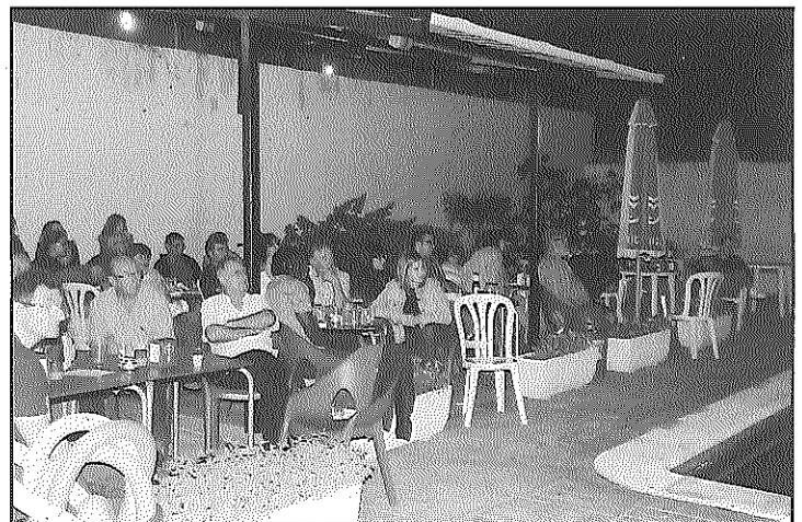
Desenes de veïns van apuntar-se a l'activitat

Com cada any, el Centre Social de Sedó i Ribera organitza activitats diverses en aquell recinte, que gestiona aquesta mateixa entitat.