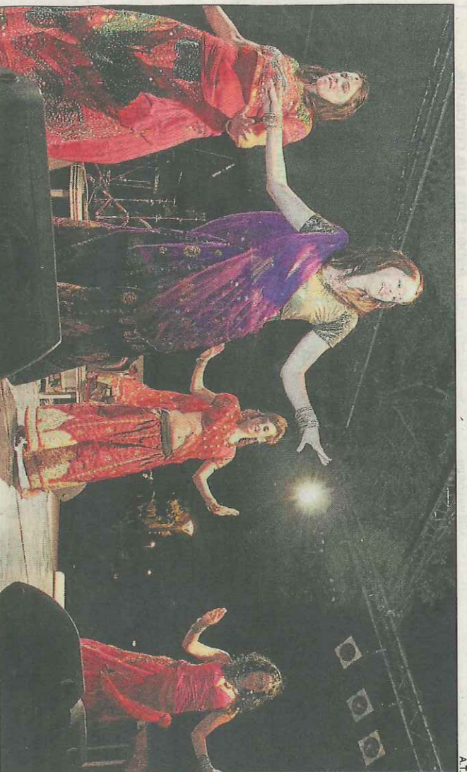
L'espectacle amb coreogràfies coloristes Bollywood, a càrrec d'unes joves de l'Anoia.

El col·lectiu Nous Espais manté el festival tot i les retallades i aconsegueix un èxit total de públic