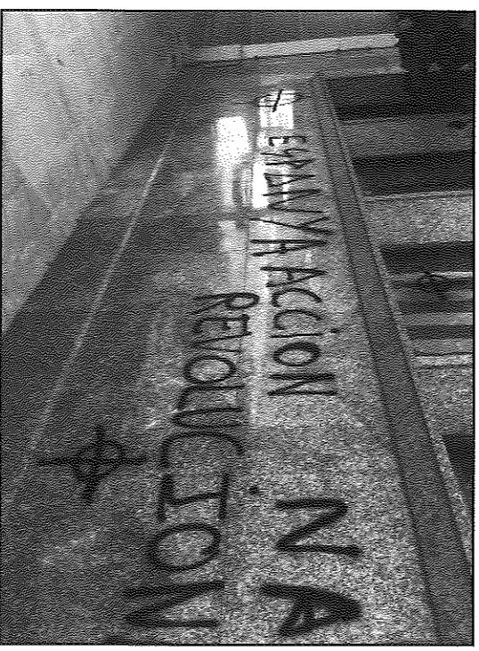
Els autors van omplir de pintades tota la façana de la seu d'ERC

La secció local d'ERC de Guissona ha denunciat aquest acte. "Revindiquem fermament el nostre rebuig al feixisme i manifestem el nostre compromís en la defensa de les llibertats de la nostra gent, del país i dels valors de la democràcia", han assegurat des de la secció republicana de Guissona.