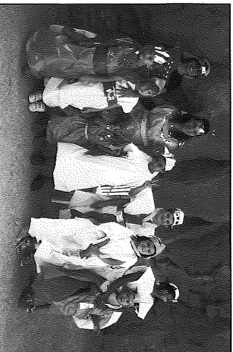
La canalla de Florejacs va representar la llegenda de Sant Jordi.

actors, els mateixos infants, i conduït per Susagna Navó. Entre altres activitats de la festa major d'aquest altre nucli, es van dur a terme un concurs de dibuix infantil i un ball amb el duet Almadrava, qui, encoratjat per la gentada que ballava a la plaça, es va encarregar també de la discomòbil que va tancar la festa a altes hores de la matinada. El dimecres va haver-hi la missa major i el vermut on cada casa porta algun menjar per compartir. La festa va acabar amb la tirada local de bitlles i el futbol humà.