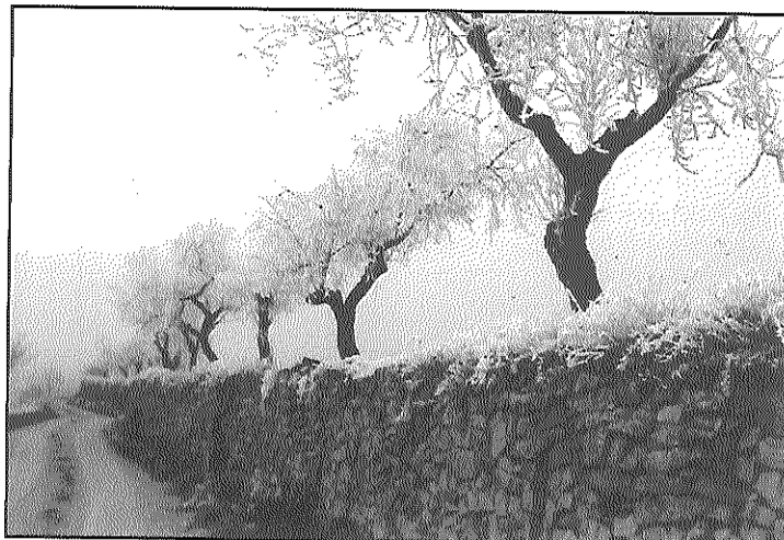
Via Gebrada, de Francesc Reguant

L'exposició de fotografies restarà oberta fins a finals d'octubre a la sala d'exposicions del nou museu, a l'edifici Fassina, on pot ser visitada de dilluns a dissabte,