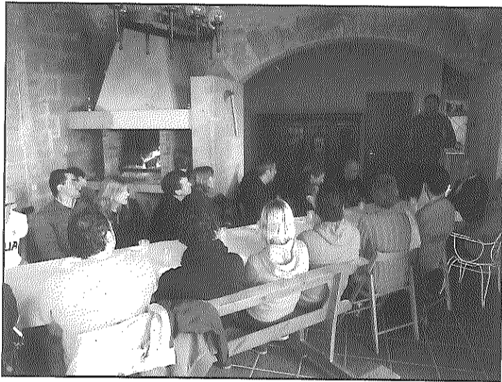
Un enòleg va dirigir el tast de cerveses artesanals

Vista la bona acollida de la iniciativa, Camins de Sikarra organitzarà properament un tast i taller de vins i canapès de Nadal al Castell de les Sitges i un maridatge d'olis d'oliva amb xocolata artesana a Torà.