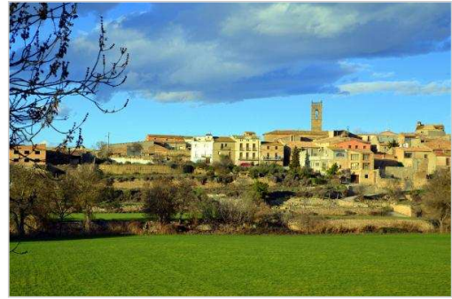
Vista de Torrefeta Autor: Angelina Llop

Home page | Torà | Campanyes | Temes a fons | Serveis | Participa | Fotos | Videos | Agenda | Anuncis | Enllaços | Realització: cdnet