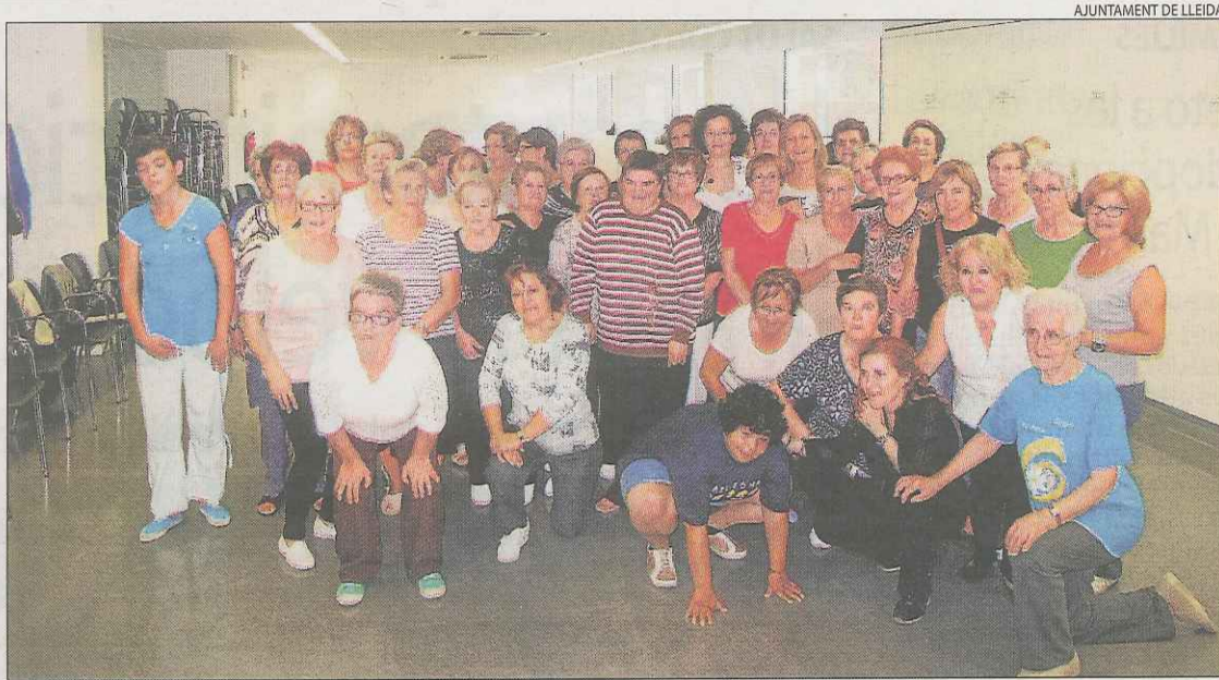
El grup de dones que ahir van participar en el primer taller del Casal de la Dona de Lleida.