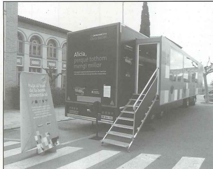
El vehicle ha estat estacionat durant dos dies al davant del Jaume Balmes

Tant la visita lliure com la guiada a la unitat mòbil són gratuïtes i els tallers tenen un preu simbòlic, per la despesa en els productes alimentaris que s'utilitzen als tallers, i van a càrrec de monitors especialitzats, nutricionistes, tecnòlegs d'aliments i cuiners experts vinculats directament a la Fundació Alícia.