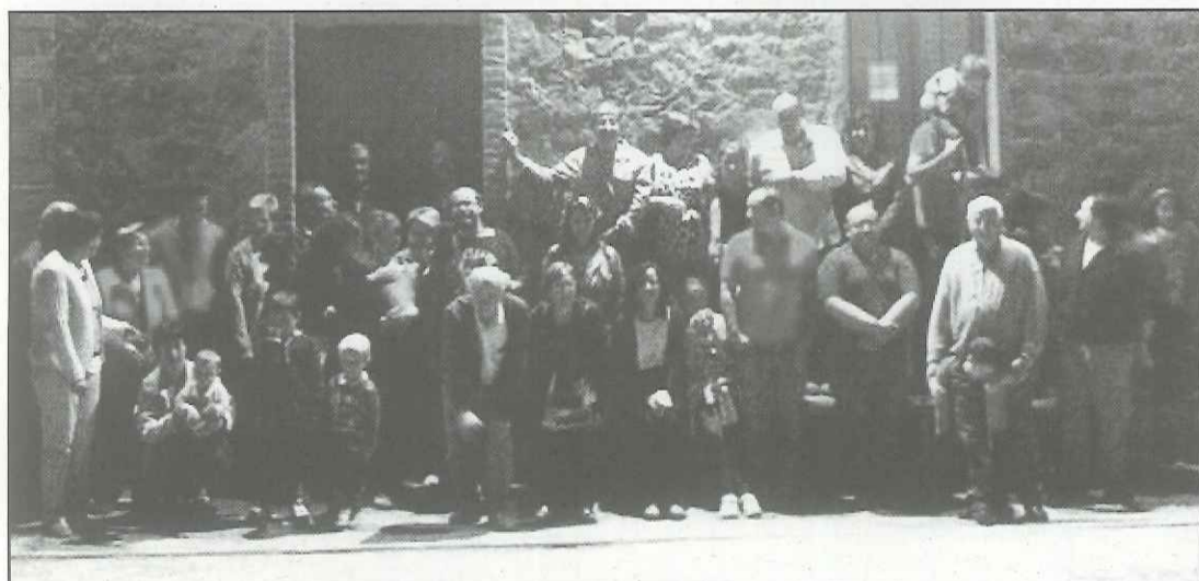
Imatge de grup dels participants en aquesta recuperada celebració

de Veïns l'Amistat de Palou és recuperar aquest esdeveniment per poder reunir als seus veïns en la seva festa major petita.