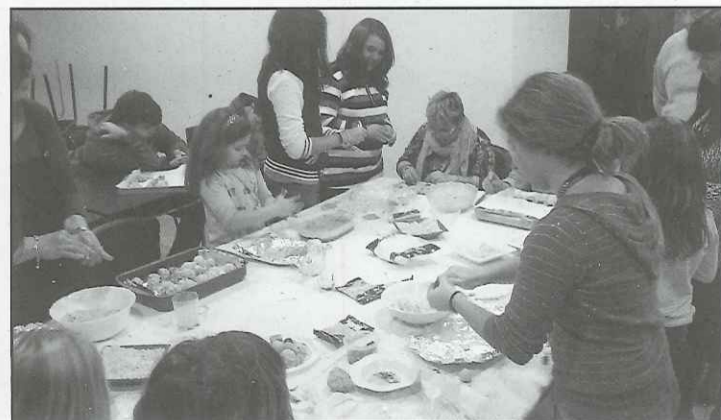
Petits i grans van participar en un taller de panellets a Torrefeta

L'associació de veïns de Torrefeta informa que ha creat un nou portal web on penjaran totes les activitats que realitzin: www.torrefeta-associacio-l-espiga.web-node.com .