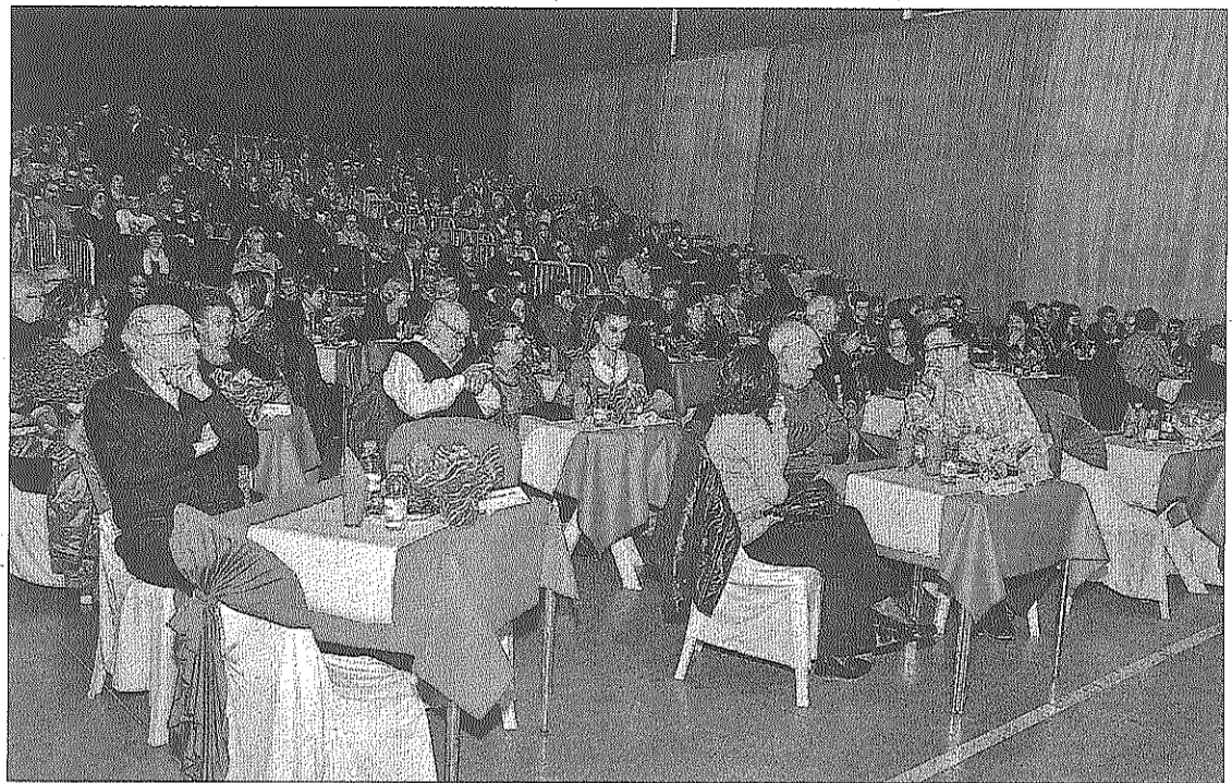
Els padrins van estar envoltats dels seus familiars i amics, durant l'emotiva celebració.

Aquest cap de setmana, el municipi de Sedó ha celebrat la festa major d'hivern, amb ball, una funció de teatre i un sopar popular en què van participar 200 persones. Durant la vetllada, es va presentar la Colla Bastonera local.