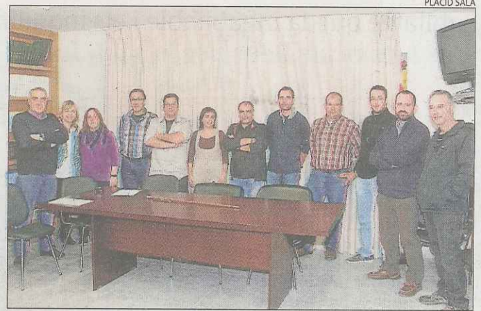
La nova corporació de Torrefeta i Florejacs.