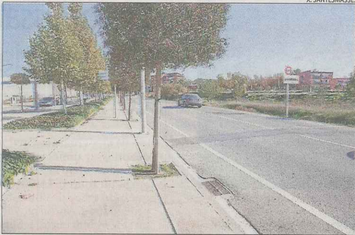
La zona on es preveu l'ampliació de l'àrea de serveis.