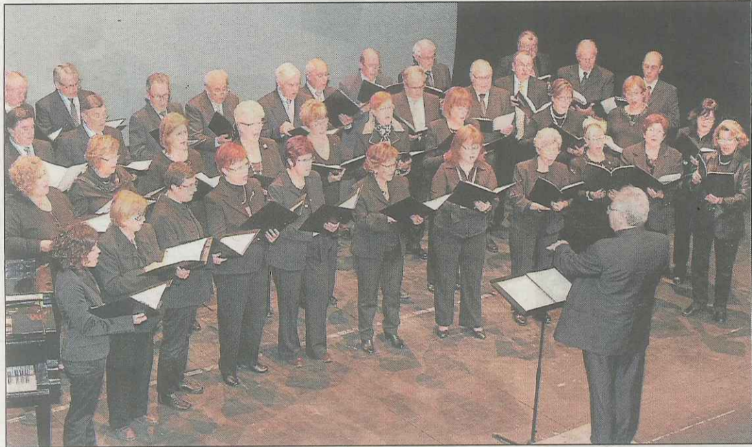
A la imatge, l'actuació de la coral Ramon Carnicer.

Els cinc grups corals de la ciutat i el grup de vent del conservatori van participar en el concert