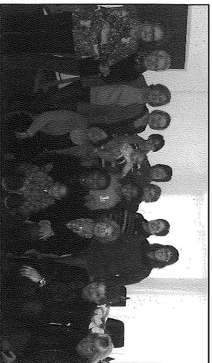
Agrup de les participants en els tallers, durant l'acte de cloenda

En el transcurs de la cloenda, es van poder veure totes les manualitats que s'han realitzat en els tallers.