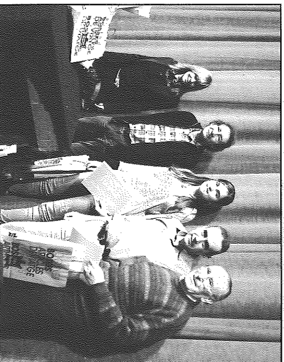
Lliurament de premis durant la representació dels Pastors de Ramon Turull

de no ser vençuda, tots aquests anys ni amb mil paranyis l'haurien fet claudicar, no era moguda ni per la boira ni pel ventseré, sols aquest ensurt i el pes dels anys... els anys per vencer-la, res mes podia trencar les ganeres de viure i de seguir caminant, caminar sota el blau cel de la seca Segarra, de qui ella, ara sols espera l'amoroseixi amb l'últim vel.