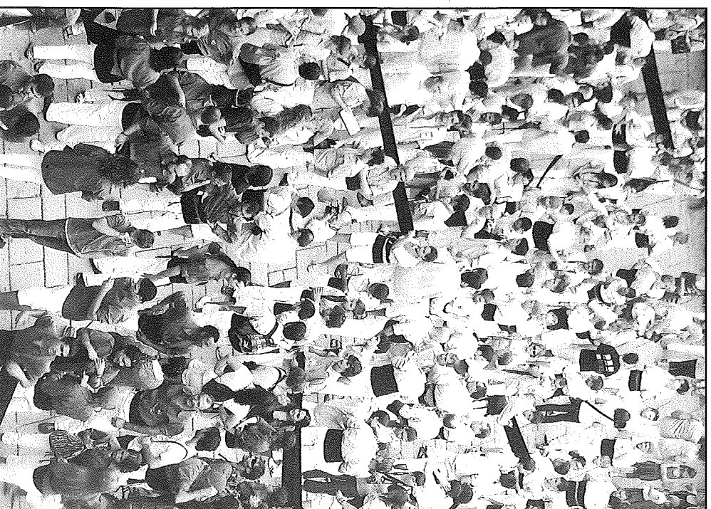
El nou indicador que s'ha instal·lat a la plaça de l'ajuntament