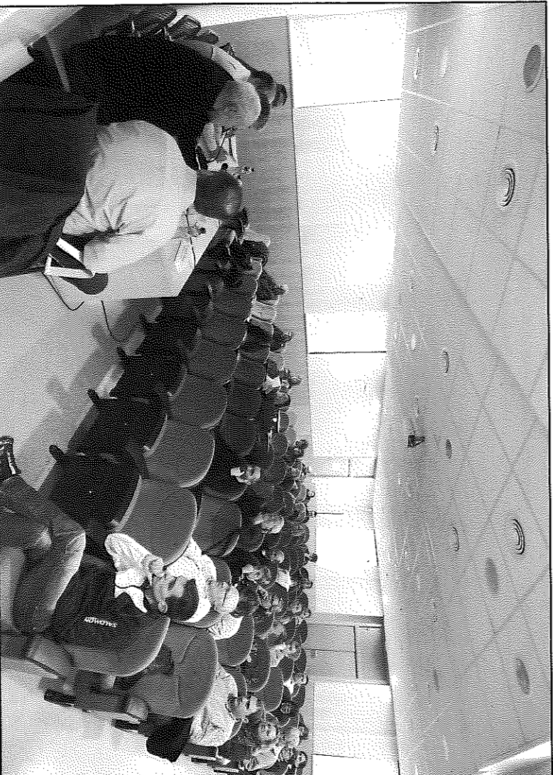
Una quarantena persones van assistir a la presentació a la sala Francesc Buirou

El portal estarà obert a totes aquelles entitats que vulguin adherir-se, les quals no hauran de demanar al Consell Comarcal a través de l'àrea de comunicació, que els hi oferirà la formació al llarg del mes de març. Es preveu que el proper 1 d'abril el portal ja sigui visible.