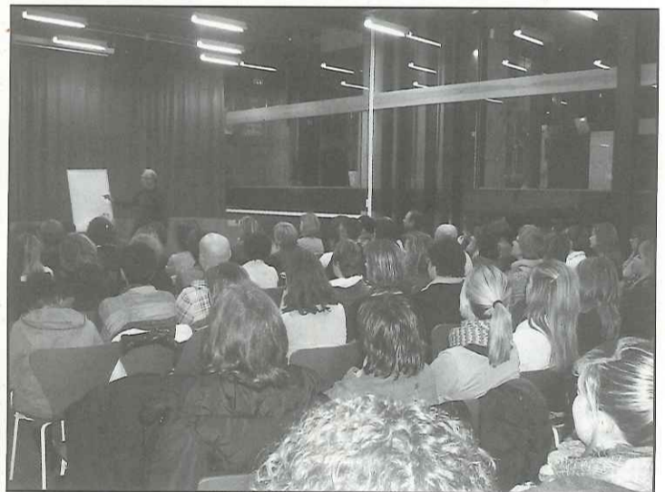
La xerrada va omplir la sala de plens de l'ajuntament

l'educació, fent èmfasi en el model educatiu de la família, i indicant que aquesta ha de donar suport a l'escola i mostrar bons hàbits de conducta. A la vegada, "des de casa s'ha de potenciar la seguretat i la confiança mútua entre pares i fills", segons l'inspector, qui creu que aquest és "un model educatiu que s'ha de començar a treballar des de molt petits, per obtenir bons resultats a llarg termini".