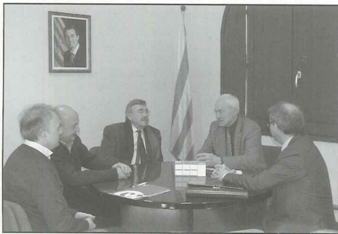
Ambdues parts van mantenir una reunió a la seu del Consell a Cervera

parts on es va analitzar l'estat actual de l'economia, el comerç i la indústria a la Segarra. A més, es va parlar dels canvis normatius que afecten a les cambres de comerç. Ambdues institucions van establir col·laboració mútua per tal d'afrontar la situació econòmica actual, especialment del comerç de la comarca.