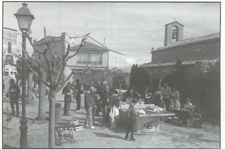
Tots els participants van compartir esmorzar a Selvanera

Organitzada per l'Associació de Veïns de Palou i l'Ajuntament de Torrefeta i Florejacs, aquesta és la primera de les caminades que es faran a nivell municipal i que estan obertes a tothom qui tingui ganes de passar una bona estona gaudint del paisatge i la natura en un ambient familiar. La propera es farà el primer de maig i anirà de Sedó a Torrefeta i l'ermita de Santesmasses, mentre que pel juny es prepara una altra ruta amb sortida des del Llor.