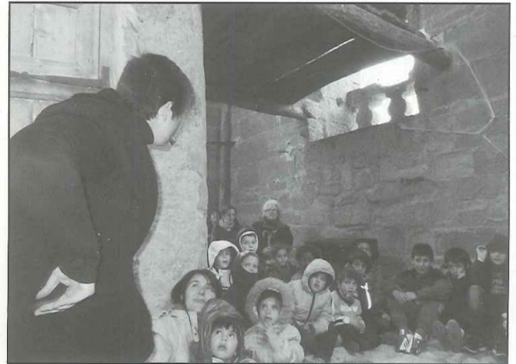
Alguns dels nens i nenes que van prendre part en la primera sessió