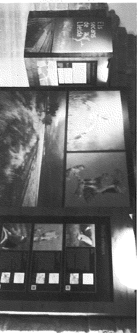
Alguns dels plafons que ben aviat es podran visitar al nou espai del Castell de Concabella

Per altra banda, la sala d'exposicions de la planta baixa del Castell de Concabella acollirà, a partir d'aquest cap de setmana, una retrospectiva de l'artista Ramon Guixé, que inclou obra del 1983 al 2013. Aquesta mostra de pintura i escultura de l'artista de Puigverd d'Agramunt serà inaugurada aquest dissabte, a les 7 de la tarda, amb un acte que presidirà Adrià Marquilles.