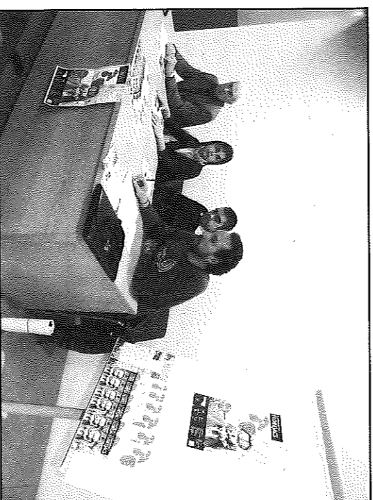
La fira va ser presentada a la Sala Francesc Buiréu

Els organitzadors preveuen que al voltant de dues mil persones visitaran el poble el dia de la fira.