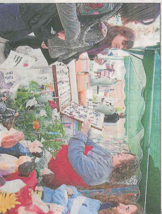
La fira ocupa la totalitat dels carrers de la població.

FLORÈACS | La Fira de la Flor de Florejac, que se celebrarà demà dissabte, comptarà amb cinquanta estands dedicats a les flors i a ornaments i tallers florals, deu més que en la passada edició. A més, s'han preparat una vintena d'activitats, com una trobada d'entitats de la cultura popular de la Segarra, un certamen literari i l'escenificació de la llegenda de la Dama de Florejac.