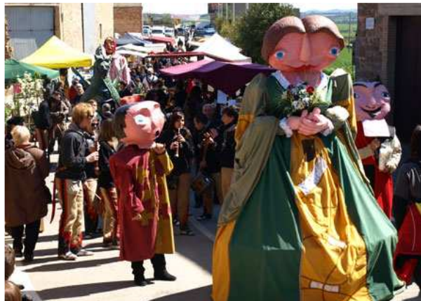
Bon temps i animació en una jornada festiva.