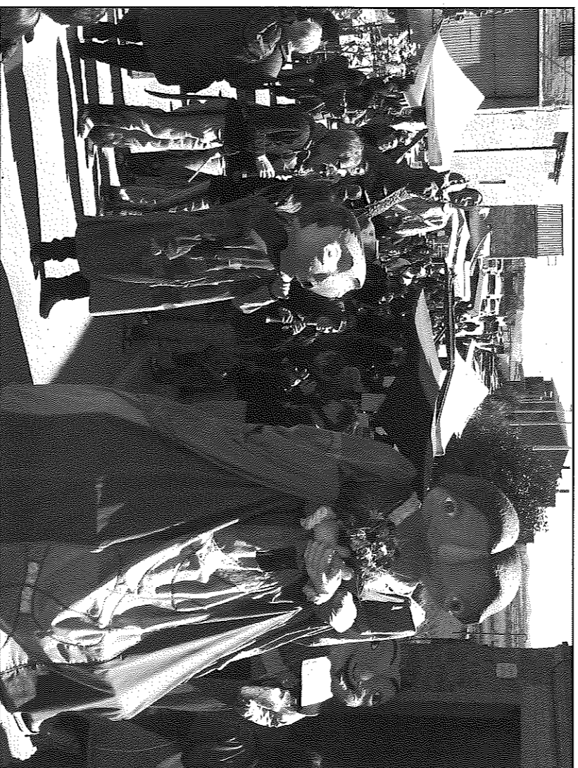
Entitats de tota la Segarra van participar en les activitats de la fira

Amb aquesta edició, la Fira de Florejacs referma un any més la seva presència en el calendari d'esdeveniments lúdics de les terres de Lleida i s'adapta al context econòmic sense perdre la seva capacitat d'innovació, integració i dinamització de les iniciatives culturals i de projecció de la Segarra.