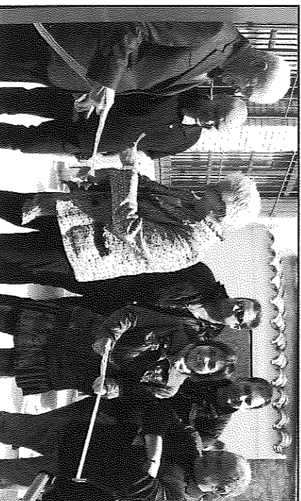
No hi va faltar el tradicional tall de la cinta inaugural

L'acte es va cloure amb l'actuació de la Colla de Bastoners de Sedó, els quals van fer el primer assaig en públic al seu poble. Finalment, un centenar dels assistents es van quedar a la calçotada que es feia al mateix Centre Social i que any rere any compta amb un major nombre de participants.