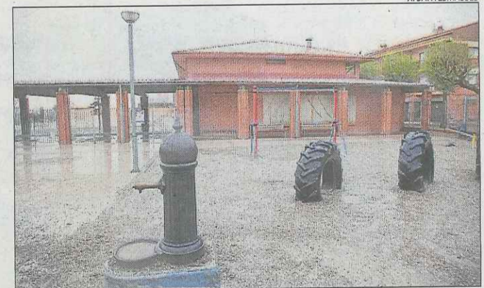
L'escola de Sant Guim de Freixenet.