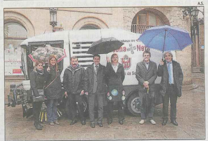
Nova màquina de neteja a Solsona ■ La nova màquina reduirà molèsties provocades per la pols i el soroll.

L'objectiu és millorar el mirador que hi ha a l'enclavament i abordar una campanya de promoció.