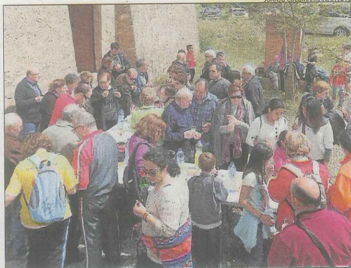
L'aperitiu que es va servir als participants a la ruta.

D'altra banda, Royes va avançar que aquest mes es firmarà el lloguer d'una de les naus de l'antiga Lear per una empresa dedicada a la fabricació de recanvis de l'automòbil.