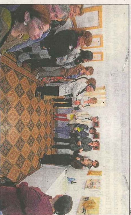
L'exposició Pa de Colze a la Cerverina d'Art.