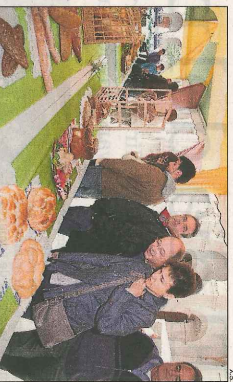
La mostra de pans del món de la passada edició de la Fira.