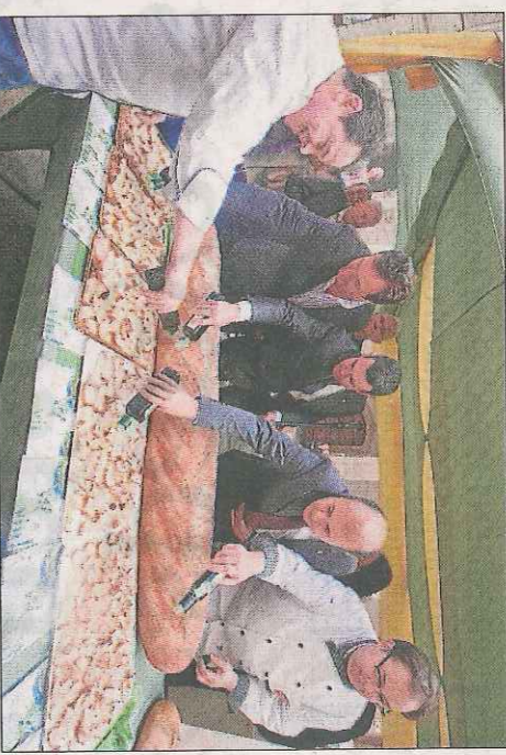
Alcalde i autoritats amb el pa de pagès i oli de les Garrigues.