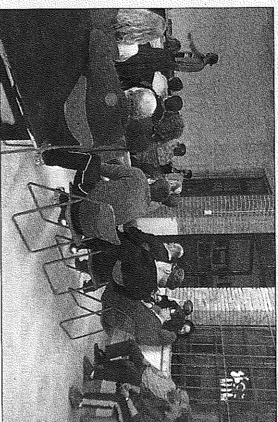
La Plataforma Aturem el Fracking ha organizado distintas conferencias

El motivo de la reunión fue trasladar la preocupación de la plataforma por el retraso que está sufriendo la constitución de la Comisión de Estudio sobre el Fracking, que aún no se ha reunido pese a que fue aprobada el pasado 10 de abril por el pleno del Parlament. ERC, ICV-EUIA y Ciudadans (C's) se comprometieron a exigir en la próxima reunión de la Junta de Portavoces que la comisión se constituya de inmediato y negaron que el problema sea