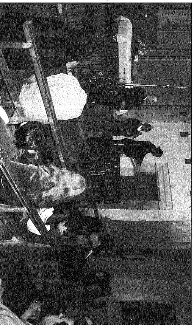
La presentació va tenir lloc a l'església parroquial de Torrefeta

L'acte es va cloure amb la intervenció d'un grup de veïns del poble de Sedó, que van interpretar els goigs de la Mare-dedéu de Santesmasses, una verge trobada que es venera en una ermita del municipi que es manté encara com a centre de romeries des dels pobles del voltant. El treball presentat recull