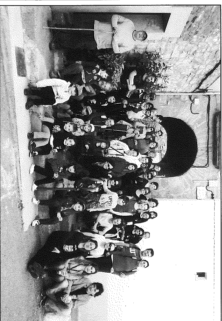
Imatge de grup dels participants en aquesta primera caminada

està obert i recollirà les imatges participants fins aquest divendres, 7 de juny. El regidor d'Esports, Pere Claver Puig, ha avançat la voluntat de l'Ajuntament d'elaborar un calendari anual de caminades dins aquest cicle de salut, esperant que als pobles de Palou, Sedó i El Llor se'n vagin afegint d'altres per crear i recuperar noves rutes a Torrefeta i Florejacs.