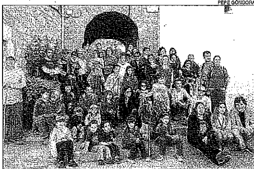
Organitzada pels veïns i l'ajuntament.