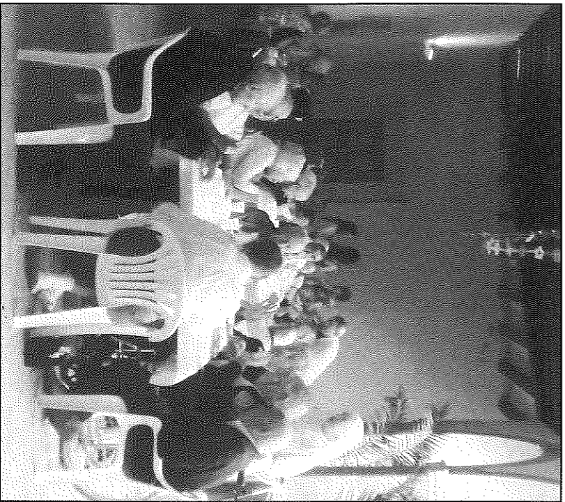
La climatologia adversa va obligar a traslladar la celebració al claustr interior

claustr interior de la residència, tot i que es va poder recol·locar en aquell espai la garlanda, per tal que residents, familiars, veïnats, treballadors i religiosos poguessin gaudir d'aquesta festa assenyada. Des de la Residència Mare Güell s'ha expressat el seu agraïment a familiars, voluntaris i amics per compartir amb ells aquesta popular revetlla.