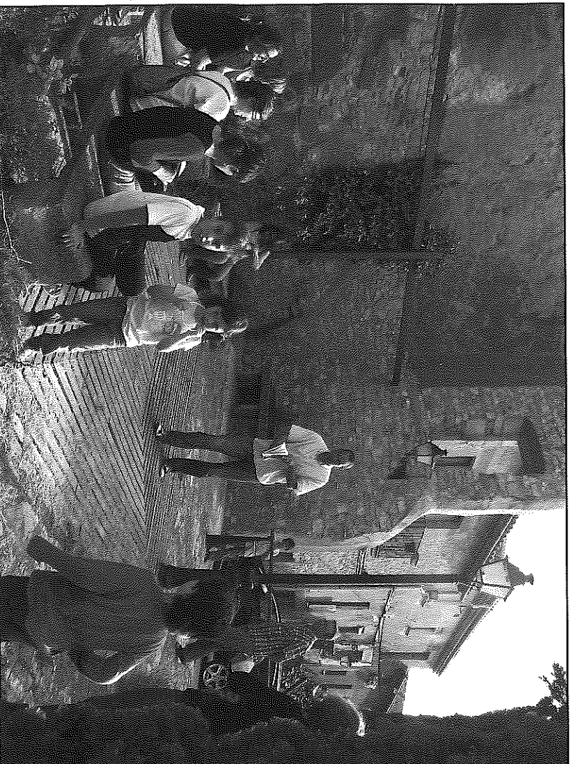
Una de les aturades que va fer l'itinerari pels racons de Tarroja mencionats en els llibres de Coma