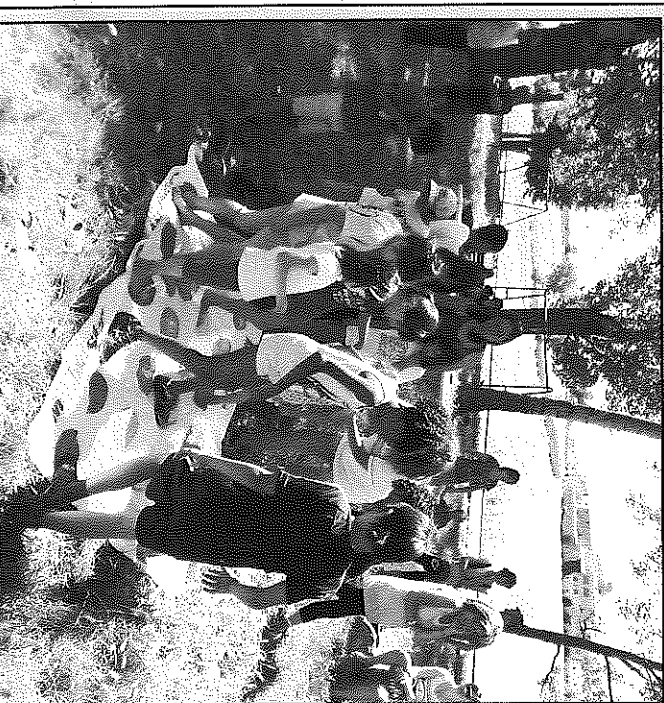
Grans i petits van poder passar una bona estona a la Font de Torrefeta

guts de Torrefeta, El Llor, Palou, Florejacs i Guissona, van passar un matí entretingut i van poder conèixer una mica més què és el Ziletres i el que representa dins la comarca. D'aquesta manera, per primer cop Torrefeta i Florejacs ha participat en les activitats que acompanyen aquest prestigiós premi cultural que organitzen conjuntament el Consell Comarcal de la Segarra, el Centre Municipal de Cultura i la Fundació Pedrolo.