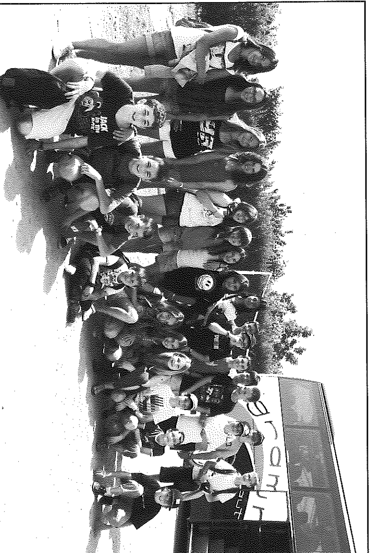
Moment de la sortida de les colònies d'enguany

Per a realització de les colònies es compta amb el suport de les AMPA de les escoles i instituts de la comarca.