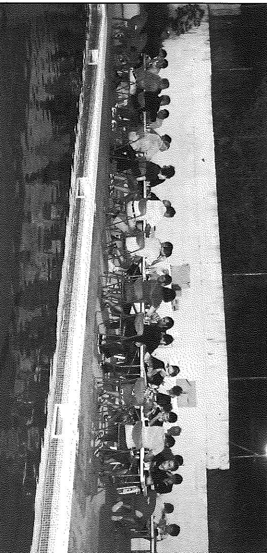
El torneig es va dur a terme ja de nit a la piscina de Sedó

comptar amb una participació encara més nombrosa, per la qual "anem tots els qui ens esteu llegint a practicar aquest joc, que és bonic, distret i barat (important en aquests temps de crisi) i que permet competir en igualtat de condicions a persones de qualsevol edat i sexe", segons els seus impulsors.