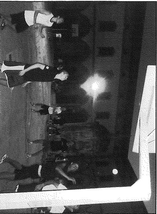
Els partits es disputen en un dels patis interiors de la Universitat

El Club Bàsquet Cervera i la Regidoria d'Esports de la Paeria, promotors de la iniciativa, creuen que aquesta és "una bona manera de passar la vesprada dels dimecres a la fresca fent salut".