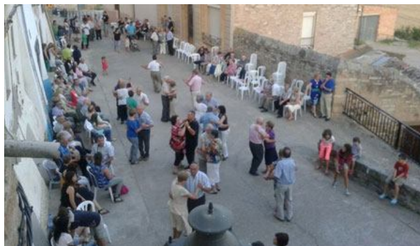
Un dels balls que van amenitzar la festa.