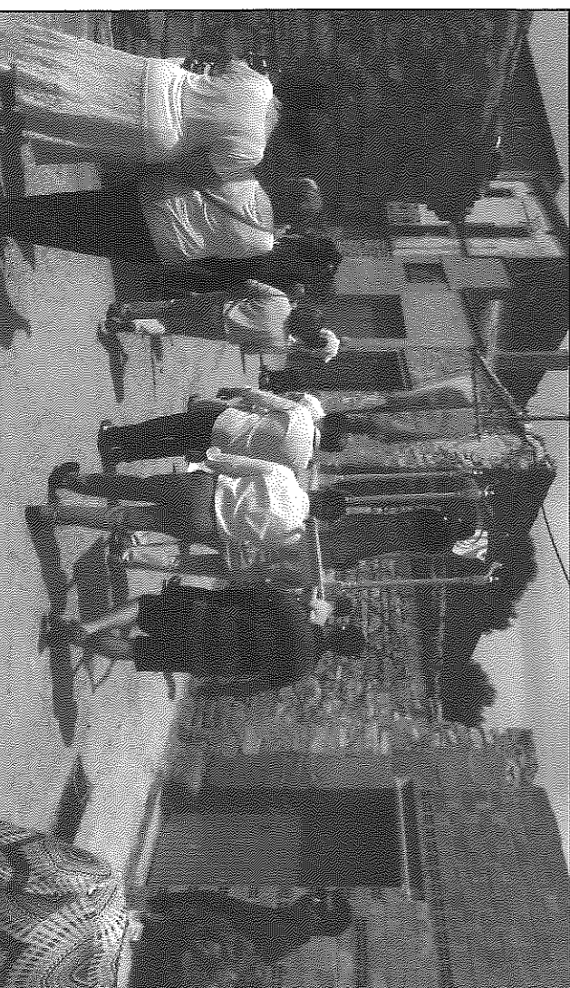
Els veïns van tornar a treure en processó la imatge del patró del poble

panera. L'associació de veïns, que valora molt positivament els actes i la participació, ha volgut agrair a tothom que s'ha implicat en l'esdeveniment, la seva presència. A Belveié seguiran les festes majors de Granollers de Segarra, aquest dissabte 27 per la tarda, amb una caminada per la Vall del Llobregós, missa i ball, i la de Ribera, durant tot el cap de setmana, amb sopar de germanor, ball, missa i vermut.