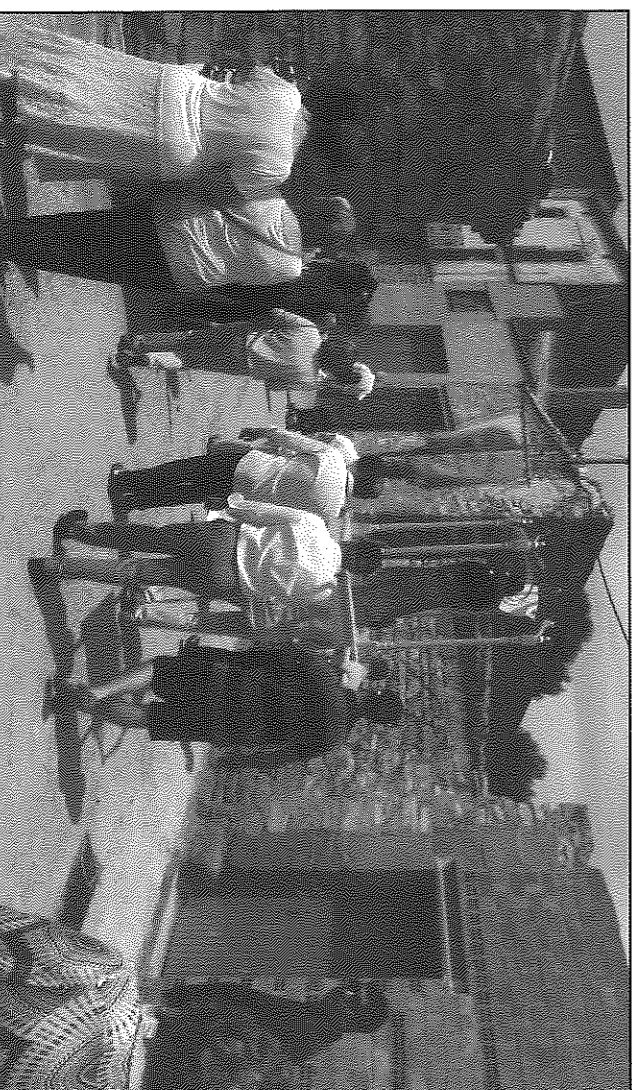
Els veïns van tornar a treure en processó la imatge del patró del poble

panera. L'associació de veïns, que valora molt positivament els actes i la participació, ha volgut agrair a tothom que s'ha implicat en l'esdeveniment, la seva presència. A Belveié seguiran les festes majors de Granollers de Segarra, aquest dissabte 27 per la tarda, amb una caminada per la Vall del Llobregós, missa i ball, i la de Ribera, durant tot el cap de setmana, amb sopar de germanor, ball, missa i vermut.